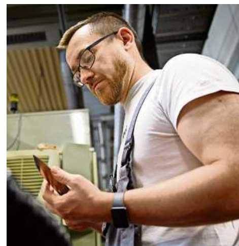
Erfahrene Fachleute achten auf die Qualität der bis zu 180 Euro teuren Produkte.