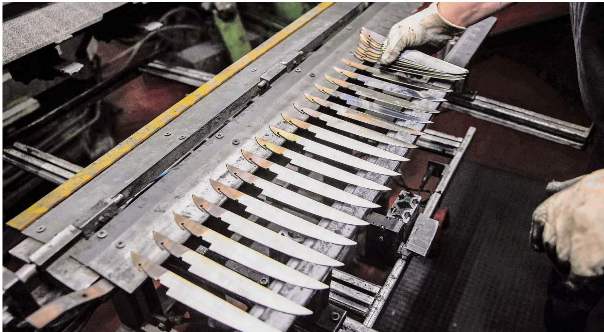
Giesser: Küchenmesser aus Hertmannsweiler, Industriemesser aus Birkmannsweiler